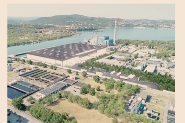
Punto strategico. Il rendering dell'impianto a Trieste