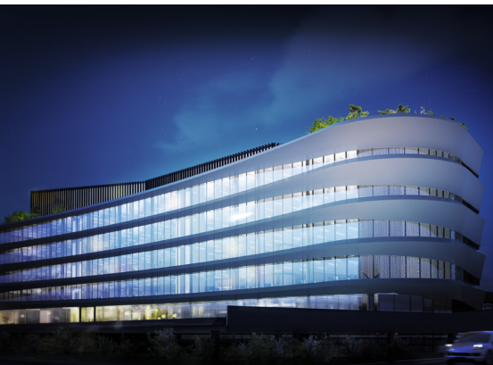
Arcadia Center, Milano © Matteo Noto courtesy Giuseppe Tortato Architetti