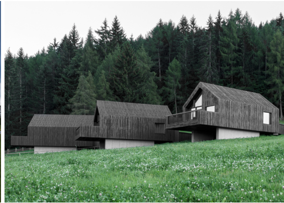
Hotel Pfösl, Nuova Ponente, Italia